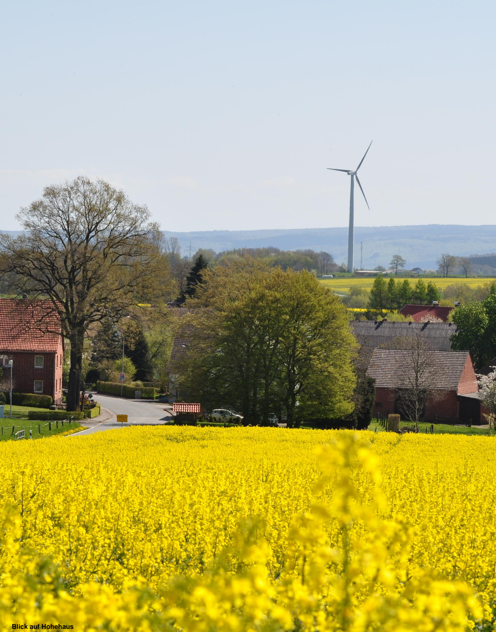
Blick auf Hohehaus